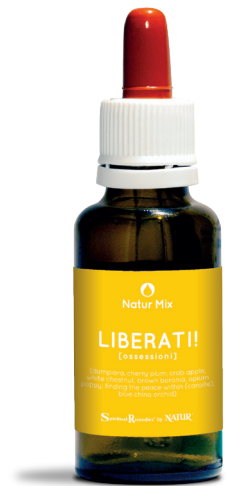
30 ml con contagocce

Blue china orchid (Living Australian Essences) - indicata per liberarsi da cattive abitudini di vita, ossessioni o comportamenti negativi. Per il cambiamento e la metamorfosi interiore.