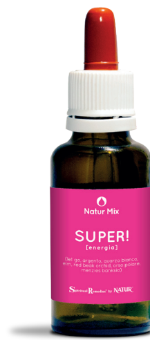
30 ml con contagocce

Orso polare (Wild Earth) - rimedio indicato per sviluppare forza interiore, potere e determinazione. Sostiene chi si sente debole e privo di forze.