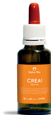
30 ml con contagocce

Blue leschenaultia (Living Australian Essences) - aiuta chi non sa esser generoso, chi si lascia assorbire dai piaceri fuggevoli degli oggetti materiali. L'energia di Blu Leschenaultia permette di vedere l'importanza dei rapporti tra gli esseri umani al di là dell'attaccamento alle cose.