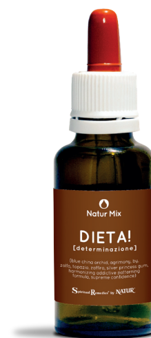
30 ml con contagocce

Topazio (Essenze Bhattacharya) - il topazio ha azione sul tessuto adiposo e sulle ghiandole, linfatiche ed endocrine e un'efficace azione dimagrante: accelera il metabolismo e la lipolisi, e diminuisce l'appetito. Avendo anche un'azione endocrina regolante, il rimedio viene consigliato in caso di obesità associata a riduzione dell'attività tiroidea o a squilibri ovarici.