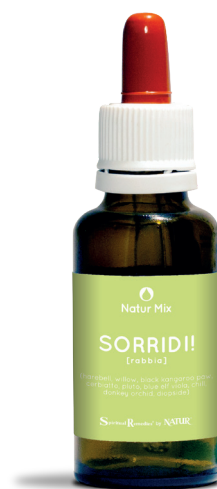
30 ml con contagocce

Black kangaroo paw (Living Australian Essences) - grazie all'energia vibrazionale di Black Kangaroo Paw si può restituire il predominio al proprio cuore e lavorare sul risentimento viscerale, sperimentando così una nuova luce e leggerezza. In questo modo si sarà in grado di perdonare e di rimettersi in cammino verso i propri obiettivi più alti.