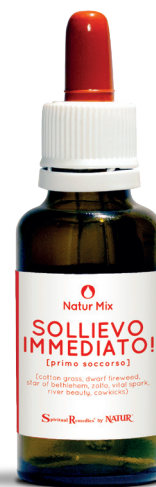
30 ml con contagocce

Cowkicks (Living Australian Essences) - indicata per ritrovare coraggio, vigore e capacità di rialzarsi con le proprie forze dopo eventi traumatici e circostanze della vita difficili. Un'essenza da usare quando ci si sente a pezzi e senza forza per andare avanti.