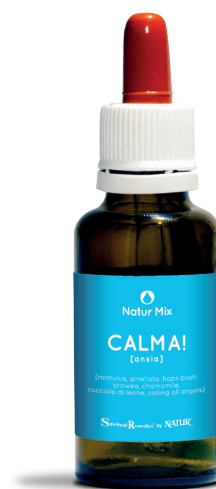
30 ml con contagocce

Calling all angels (Alaskan Flower Essence Project) - dona una dolce ed amorevole energia nel corpo, rilassamento e pace profondi. Fa crescere la consapevolezza che ogni giorno si è protetti e guidati dall'amore e dalla protezione degli angeli.