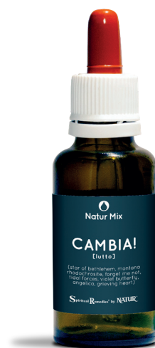
30 ml con contagocce

Grieving heart (Wild Earth) - la formula permette di elaborare dolore e tristezza e di liberare il cuore. Di aiuto anche nei casi di lutto e disperazione profondi. La formula è composta da 3 essenze animali: Cavallo selvaggio, rafforza i cuori in via di guarigione e libera il chakra del cuore dal dolore; Ippopotamo, per abbracciare i propri sentimenti più profondi; Gazzella, per sentirsi al sicuro, pur sperimentando la sofferenza.