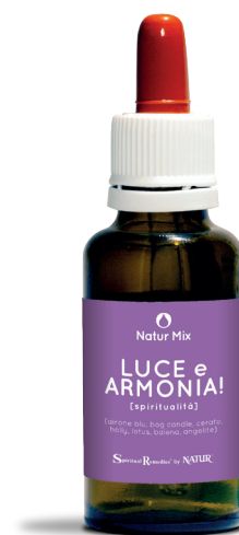
30 ml con contagocce

Angelite (Acque Tibetane Cristalmantra) - mette in contatto con la nostra anima per capire cosa è giusto per noi in un determinato momento, ascoltarlo e realizzarlo. Aiuta nei periodi bui e insegna a vedere il significato di eventi dolorosi.