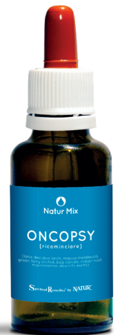
30 ml con contagocce

Down to Earth (Himalayan Flower Enhancers): potenzia l'energia sessuale e vitale. Aiuta in caso di libido bassa, per le ferite della sfera sessuale, la mancanza di radicamento, l'ansia per la sicurezza materiale dell'esistenza, le paure nascoste, lo stress, la pigrizia e la mancanza di stimoli.