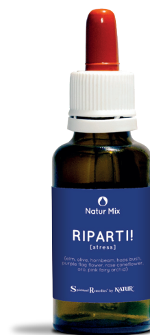
30 ml con contagocce

Pink fairy orchid (Living Australian Essences) - indicata nei periodi di stress quando si è ipersensibili all'ambiente circostante e alle energie delle emozioni degli altri, per chi tende a lasciarsi condizionare ed influenzare. Utile per mantenere forza interiore, pace e stabilità in ogni momento o situazione.