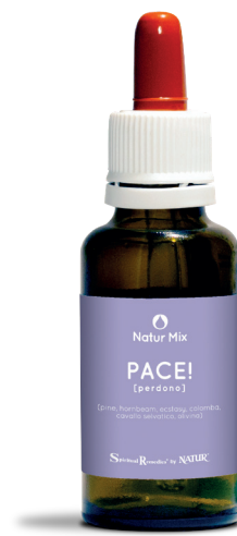
30 ml con contagocce

Olivine/Peridot (PHI Essences - Essenze di cristalli) - Stimola il terzo e il quarto chakra. Per un cuore aperto impregnato di amore e gioia. Allenta le tensioni e porta flessibilità. Contribuisce a creare un'abbondanza d'amore, di gioia e di miglioramenti nella propria vita emotiva. Aiuta a sottrarsi dalle influenze esterne e ad imparare dall'esperienza secondo la propria natura. Conferisce sicurezza e calore, allontana i meccanismi difensivi dell'ego come l'arroganza e l'autocommiserazione. L'Olivina aiuta a riconoscere i propri errori ed a perdonare se stessi.