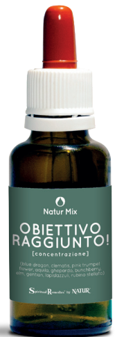
30 ml con contagocce

Rubino stellato (Alaskan Flower Essence Project) - ottima per coloro che si lasciano facilmente distrarre o che di proposito mantengono la distrazione nella propria vita.