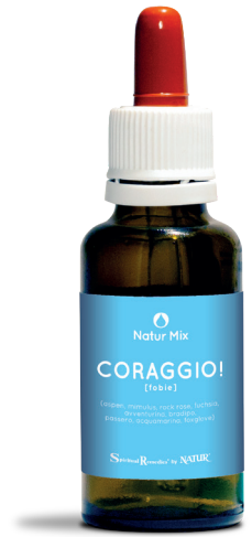
30 ml con contagocce

Foxglove (Alaskan Flower Essence Project) - utile quando c'è una perdita di prospettiva su come affrontare le situazioni, per l'incapacità di vedere il cuore di un problema in situazioni di paura o confusione. Attraverso l'assunzione di questa essenza si favorisce l'apertura del cuore, la flessibilità e una visione chiara delle soluzioni ai problemi.