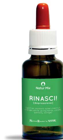
30 ml con contagocce

Borage (Flower Essence Services) - utile nei casi di scoraggiamento, sconforto e pesantezza del cuore; nei momenti in cui l'individuo prova troppo dolore, tristezza o sta vivendo delle avversità il centro d'energia del cuore si contrae. Borage dona all'individuo un nuovo senso di sollievo, di coraggio e di leggerezza.