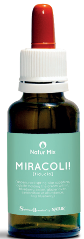
30 ml con contagocce

Bog Blueberry (Alaskan Flower Essence Project) - aiuta coloro che hanno resistenza alla vita ed un modo di pensare inflessibile che blocca l'abbondanza in cui si manifesta l'universo, non accettando la forma in cui essa appare. In questo modo si impedisce alla pienezza della vita di raggiungerci. Bog Blueberry dona flessibilità e la capacità di accettare i doni dell'universo in maniera incondizionata e senza preconcetti.