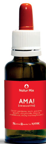
30 ml con contagocce

Sticky monkeyflower (Flower Essence Services) - questa essenza è indirizzata a coloro che hanno paura dell'intimità e del contatto umano e che mascherano questa paura cercando rapporti sessuali che non richiedano una partecipazione del cuore o una vulnerabilità emotiva. Sticky Monkey Flower favorisce il rapporto tra gli impulsi ed i desideri sessuali, con i sentimenti di calore ed amore.